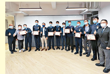
港九電船拖輪商會與政府及學校合辦「與CEO同行」師友計劃，行業翹楚擔任友師，透過建立長遠關係，與友員分享行業的知識及事業發展的經歷。(資料由客戶提供)

另外，為鼓勵有志投身、重返或現職海運業人士提升技能或獲得專業資格，「基金」下的「專業培訓課程及考試費用發還計劃」涵蓋本地船舶業相關的專業訓練課程及技能考試，每名成功申請人可獲發還有關核准課程/考試費用的80%，在計劃下每人可獲資助上限為30,000元。