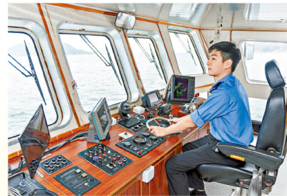
學生登上「海上教室」，在經驗導師指導下練習駕駛本地船。

從以往只以考取「遊樂船隻二級操作人證明書」為最終目標，課程在革新後擴展到涵蓋擔任各類型本地船初級船長的專業資格，將來甚至有機會加入營運管理課題，令學生的就業出路及事業發展更多元化。學校亦透過切入各項的價值觀和共通能力的訓練，例如堅毅精神、責任感、紀律性、解難能力、溝通能力和自我管理能力的等，讓學生培養船長應有的態度和特質。學校將「本地船長三級證明書」（相等於資歷架構第二級）考試的內容納入新課程，並安排學生在畢業前參加該考試。及格的學生在畢業後累積三個月的船上工作經驗，便具備擔任初級船長的專業資格，可以開展本地船長的事業。